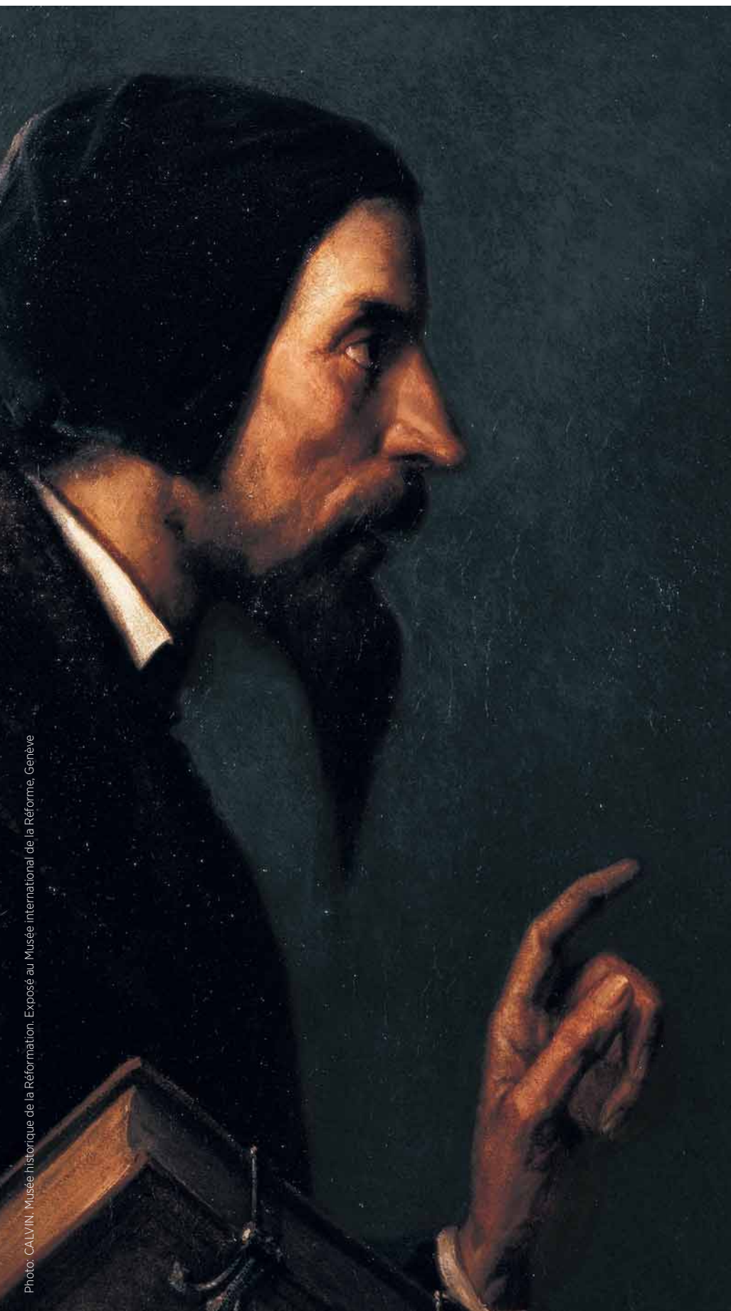
Photo: CALVIN, Musée historique de la Réformation. Exposé au Musée international de la Réforme, Genève